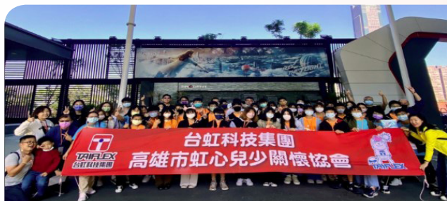
▲ 遊學高雄活動 ▲