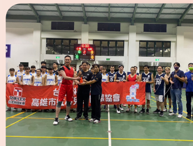
▲ 贊助小港高中籃球隊制服 ▲